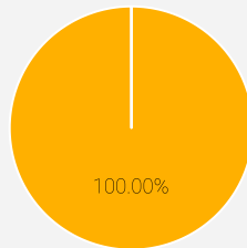
1. Taxonomiförenlighet hos investeringar, inklusive statliga obligationer*

De två diagrammen nedan visar i grönt minimiprocentandelen investeringar som är förenliga med EU-taxonomin. Eftersom det inte finns någon lämplig metodik för att avgöra hur taxonomianpassade statliga obligationer är*, visar den första grafen taxonomianpassningen med avseende på alla den finansiella produktens investeringar, inklusive statliga obligationer, medan den andra grafen visar taxonomianpassningen endast med avseende på de investeringar för den finansiella produkten som inte är statliga obligationer.